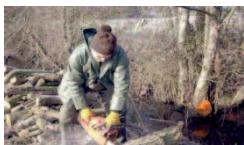
Nettoyage des rives du Rigolet

Samedi 7 mars au Rigolet à partir de 8 h et Dimanche 8 mars 2009 aura lieu l'ouverture de la pêche à la truite au lavoir de Sarré avec sa petite guinguette.