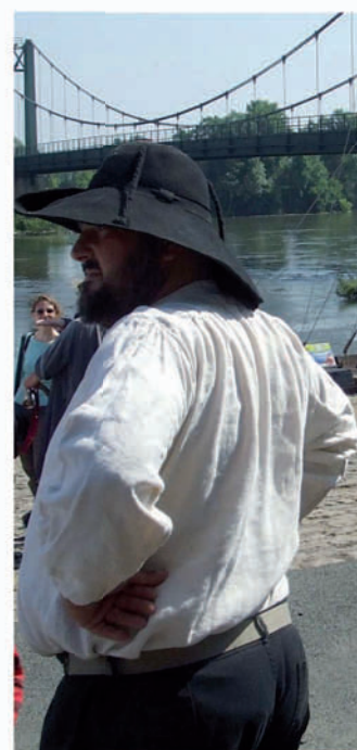
Le 22 mai, baptême de la « Nonchalante » (gabare de Loire) et présentation des bateaux (toue cabanée, sablière) par l'Association HISSEO