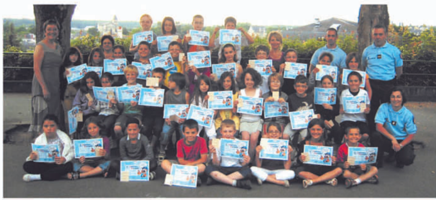
Le 28 juin, remise des diplômes « Permis piétons » par la gendarmerie, aux CE2 et CM1 de l'école Jules Verne