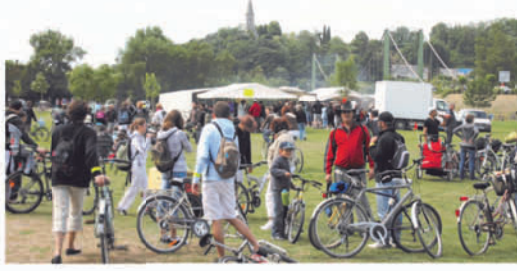
Le 20 juin, la Fête du Vélo