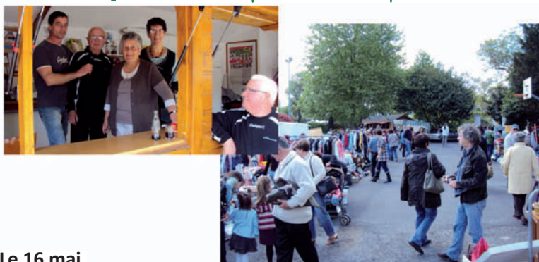
Le 16 mai, Vide grenier de Gennes Pétanque: des organisateurs heureux !