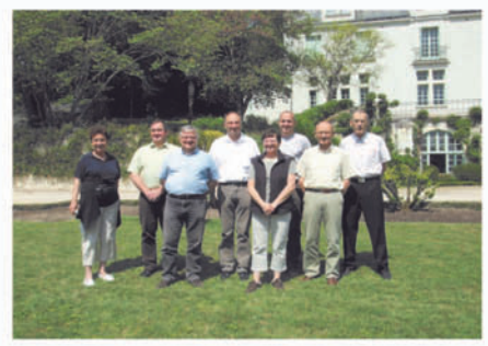
Les Genniers à la rencontre des Gennois. Les élus genniers de Gennes dans le Doubs étaient en visite dans notre commune: de riches moments d'échanges.