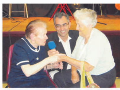
Le 17 juin, bonne humeur au repas des familles de la Maison de retraite St Vétérin