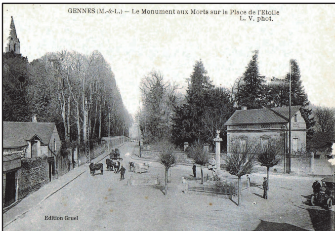
La place de l'Étoile après 1920

Après la réalisation de la route de Saumur en 1857, la forme étoilée du carrefour formée par les différentes artères, entraîna l'appellation populaire de place de l'Étoile (on trouve aussi le nom de place de Gennes ).