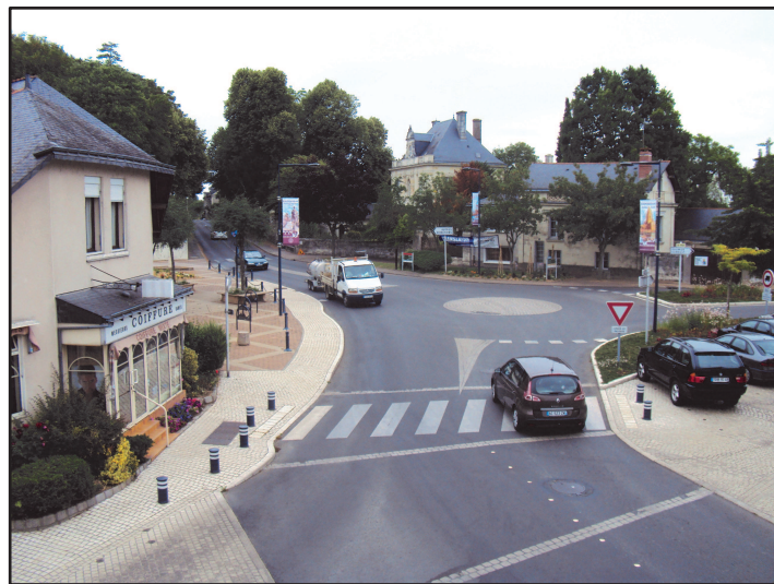
La place de l'Étoile en 2011

Le 28 novembre 1920, au centre de la place de l'Étoile, est inauguré le monument en hommage aux Gennois morts au cours de la guerre 1914-1918. Celui-ci a été déplacé dans le jardin de la mairie en avril 1987.