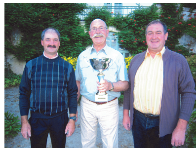
Challenge Marianne (boule de fort)

N.B. Les comptes-rendus complets des réunions de conseil municipal sont affichés à la porte de la mairie après chaque séance.