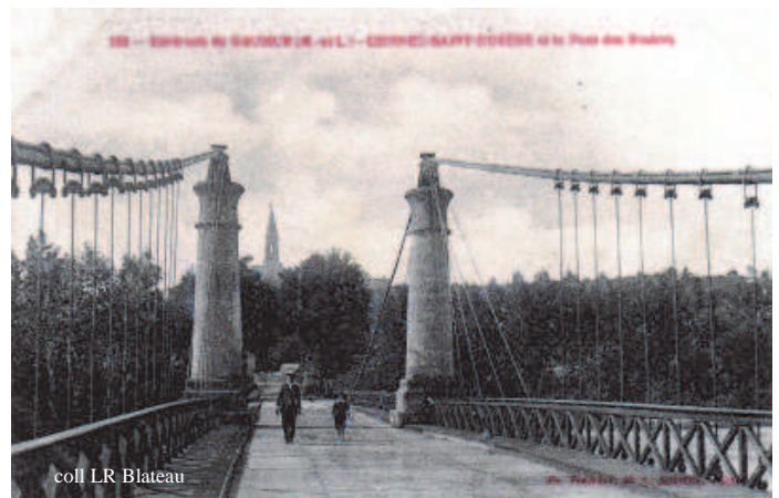
Le pont de Gennes-les Rosiers au début du XXème siècle

En 1930, l'éclairage des ponts fut envisagé. Le coût devait être supporté par moitié par les communes des Rosiers et de Gennes. Dans sa séance du 6 septembre 1930, le CM jugea que le devis présenté par la Société d'éclairage électrique qui s'élevait à la somme de 2 400 F. était trop cher. Le projet ne vit pas le jour. Il fallut attendre plus de 50 ans pour voir les ponts sortir de l'ombre.