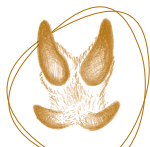
Trace de sanglier