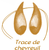
Trace de chevreuil

La forêt communale de Gennes est peuplée de nombreux mammifères. Soyez attentif aux traces que vous pouvez rencontrer au fil de votre parcours, car sangliers, renards, chevreuils, écureuils et blaireaux habitent les bois.