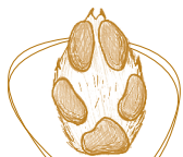
Trace de renard roux