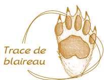
Trace de blaireau