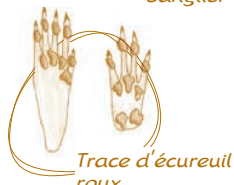
Trace d'écureuil roux

L'étang de Joreau et ses abords sont aussi le nid d'oiseaux telle que la foulque macroule. Celle-ci se reconnaît aisément par son écusson frontal, son bec blanc et son plumage noir.