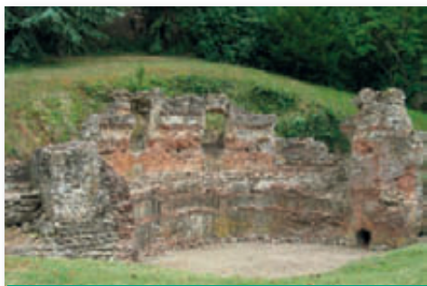
Nympheum du Mardron

Pour répondre aux critères d'éligibilité demandés par le Comité Départemental du Tourisme dans le cadre des « villes et villages remarquables de l'Anjou » le second volet de cette étude portera sur le domaine de la restauration et de l'hôtellerie. Cette seconde étape, sera réalisée dans la première moitié de 2011 par un cabinet d'étude touristique.