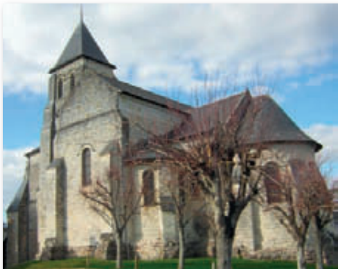
Église Saint Véterain

Action 2 - Amphithéâtre : mise en place d'un nouveau fonctionnement (entrée libre), nettoyage et sécurisation du site, réalisation d'un itinéraire de découverte scénographié et d'un équipement pour les spectacles.