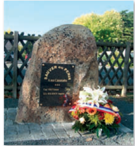
Photo : Stèle inaugurée le 9 Octobre 2010, devant la caserne des pompiers à Gennes.

Le sous-lieutenant Auguste Bourbon est mort noyé en Loire, le 14 Octobre 1960. Il portait secours à des personnes qui se trouvaient en difficulté alors qu'elles étaient occupées à réparer l'installation de dragage de sable en aval du pont de Gennes. Ce jour-là, deux autres gennois devaient périr : MM Frappereau et Colin et deux autres furent sauvés de justesse. Ce drame est encore en mémoire de tous les anciens gennois. Le corps du courageux sous-lieutenant BOURBON ne fut retrouvé qu'un mois plus tard au niveau du Thoueil.