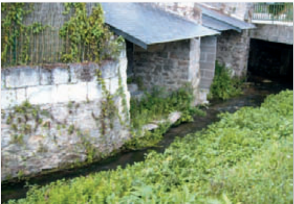
Lavoirs de l'Avort

Action 5 - Circuits équestres et vtt : création de boucles Gennes / Saint-Rémy / Blaison et Gennes / Chêne-hutte / Saumur.