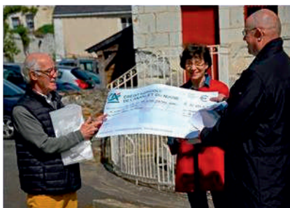
Remise d'un chèque de 20 683,86 € par la Fondation du Patrimoine.