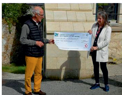
Remise d'un chèque de 3 634 € par la Fondation du Patrimoine à l'association Le Thoureil, Patrimoines et Paysages.